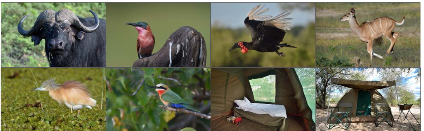
Le camp est monté pour 2 ou 3 nuits. Chaque participant dispose de sa propre tente équipée d'un lit de camp.